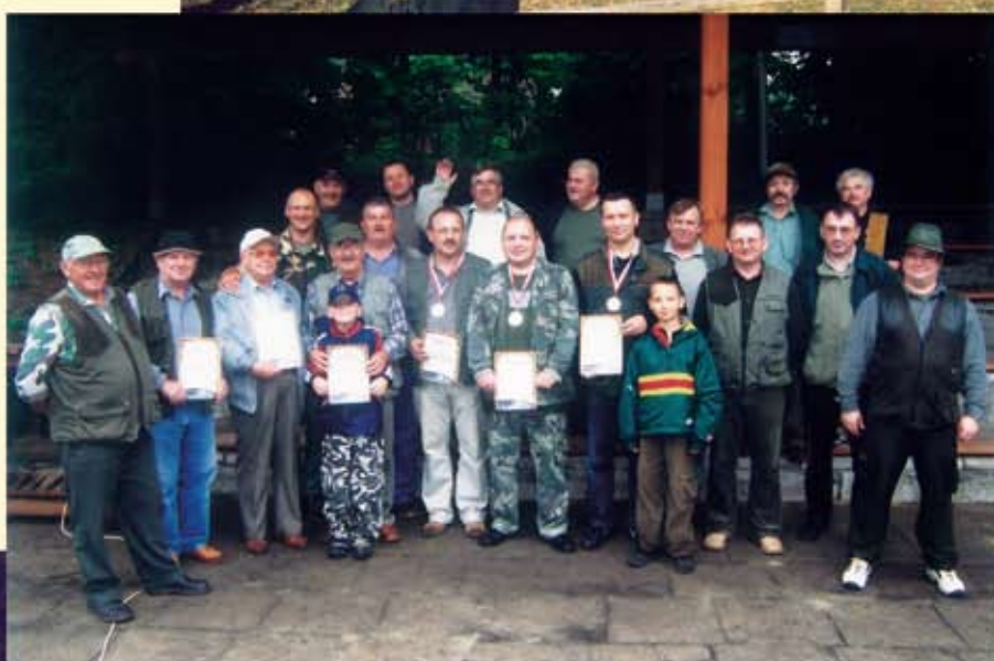
Duże sukcesy na strzelnicy w Gdańsku