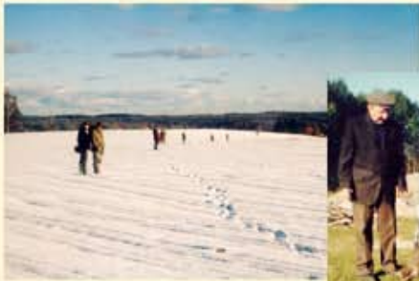
Załawowo – obstawiamy miedze