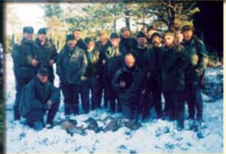
Ostatnie strzelone zające